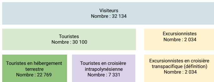
Fig. 2. Répartition du nombre de visiteurs par catégorie : cumul de janvier à mars 2022